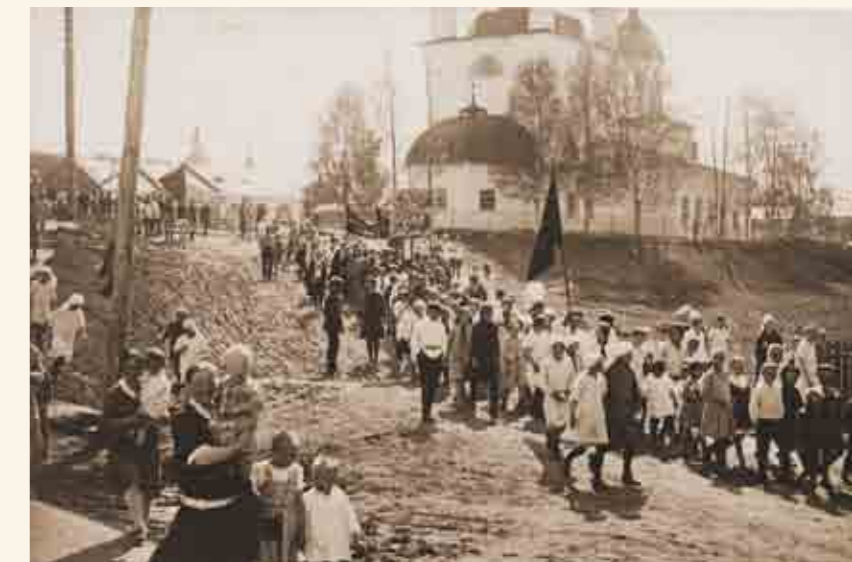
Первомайская демонстрация в Белозерске. Фото 1929 года из собрания Белозерского областного краеведческого музея

При советской власти пришла пора технической модернизации и рыболовного промысла на Белом озере, начали использоваться рыболовные суда на моторной тяге. Всё это привело к увеличению общей эффективности промысла при сокращении числа рыбаков. В промысел начали активно внедряться способы рыбодобычи, которые обеспечивали наибольшие уловы. К таким способам относились так называемый «околоточный» лов и траловый промысел. Лов рыбы «околотком» был изобретением местных рыболовов и существовал в первой половине XX века только на Белом озере. Этот способ коллективного зимнего рыболовства представлял собой комбинацию сетного и неводного лова, охватывавший значительные по площади