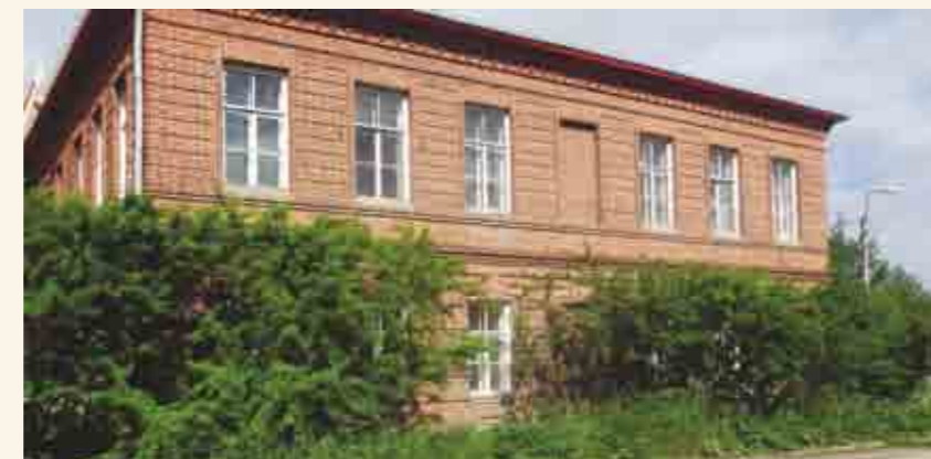
Здание бывшего городского училища, переданное Белозерскому областному краеведческому музею.

Музей расширяется: в 2006 году в здании около Спасо-Преображенского собора открылся музей природы, реставрируется переданное под экспозицию музея здание бывшего городского училища на улице Фрунзе.