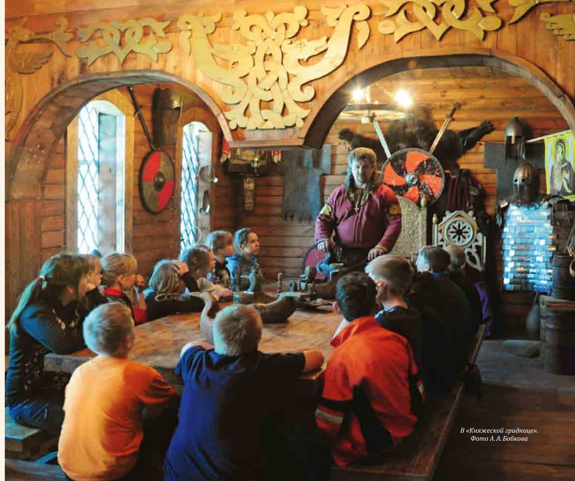
В «Княжеской гриднице».

В настоящее время Департаментом культуры Вологодской области и Белозерским музеем в содружестве с Институтом археологии Российской академии наук ведутся работы по созданию на территории Старого Города на Шексне музея-заповедника «Белоозеро», что позволит защитить этот уникальный памятник археологии от разрушений и повысить туристическую привлекательность края.