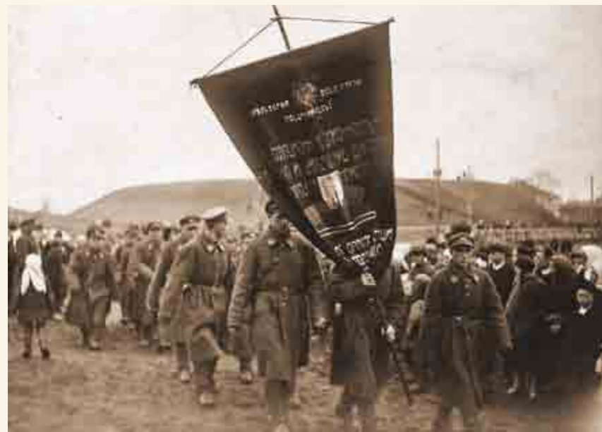
Демонстрация в Белозерске в честь девятой годовщины Октябрьской революции. Фото 7 ноября 1926 года из собрания Белозерского областного краеведческого музея