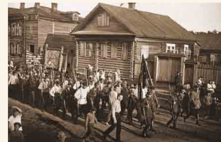
Демонстрация в Белозерске. Фото 1929 года из собрания Белозерского областного краеведческого музея