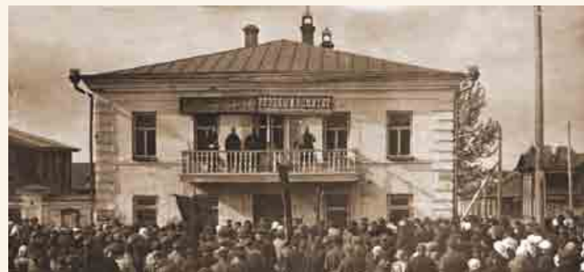
Митинг протеста в Белозерске против полицейского налёта, произведённого в Лондоне на советское торговое представительство 12 мая 1927 года. Фото 1927 года из собрания Белозерского областного краеведческого музея

объясняется тот факт, что советская власть в Белозерском уезде установилась раньше, чем во многих других уездах губернии. Определённую роль сыграла и опора агитаторов на местный солдатский комитет из представителей частей, охранявших Мариинскую водную систему. 7–11 декабря 1917 года в Белозерске состоялся I уездный съезд Советов рабочих, солдатских и крестьянских депутатов.